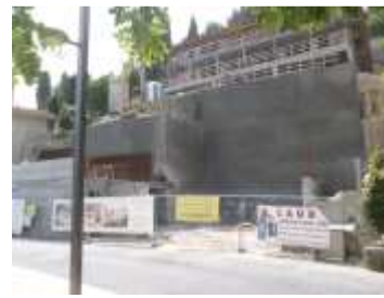
2012 un grand mur de béton