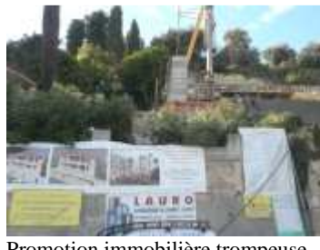
Promotion immobilière trompeuse