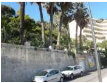
Octobre 2011, des agrumes, 7 palmiers