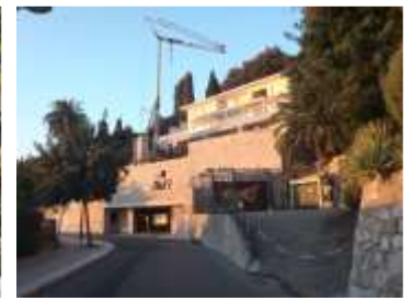
2013 du béton et une jardinière

Boulevard de Garavan, Résidence l'Orchidée. Les 7 palmiers centenaires et les agrumes ont disparu.