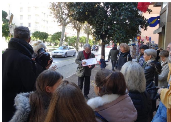
Atelier « Biodiversité en ville » du 24 novembre